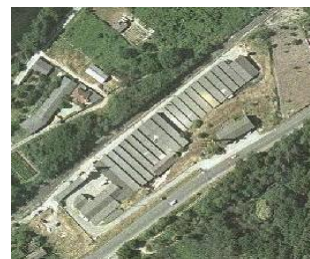
Hijos de Luis Chao Sobrino, S.A.

Barrio Estación, s/n 32.400 Ribadavia (Ourense).